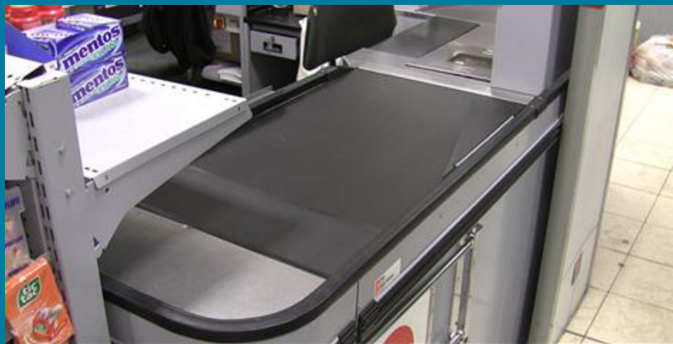
STANDAARD ZWARTE KASSABAND

Uw reclameboodschap bereikt de consument op de minst geoptimaliseerde advertentieruimte in de winkel, en dit op alle momenten van de dag.