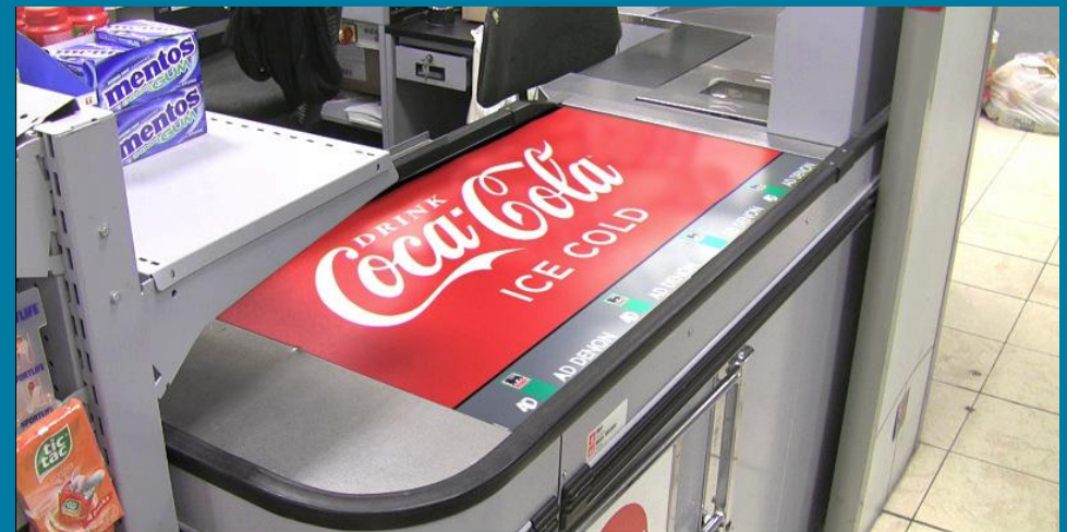
DELHAIZE COCA COLA TEMPLATE